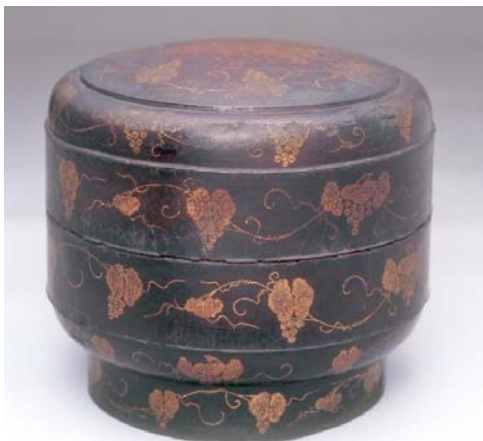
くろうるしぶどうりすちんきんじきろう 黒漆葡萄栗鼠沈金食籠