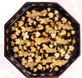
葡萄栗鼠をデザインしたお盆

正殿二階にある王様の玉座には、葡萄と栗鼠の彫刻が施されていました。玉座を飾った葡萄と栗鼠の模様でデザインされた、琉球漆器の展示を行います。