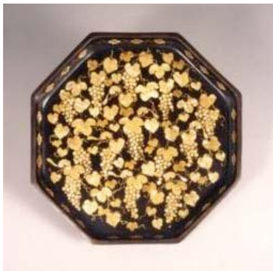
くろうるしぶどうり すらでんはくえはつかくぼん 黒漆葡萄栗鼠螺鈿箔絵八角盆