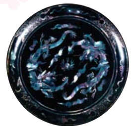
龍をデザインしたお盆

首里城正殿で、最も象徴的な「龍」の模様でデザインされた琉球の工芸品の展示を行いながら、首里城公園開園20周年記念フレイブントとして開催します。