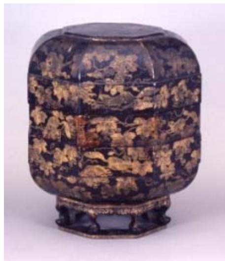
くろうるしぶどうり すちんきんはつかくじきろう 黒漆葡萄栗鼠沈金八角食籠