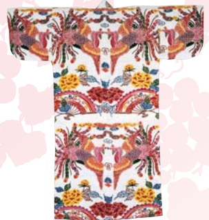
牡丹をデザインした紅型衣裳

牡丹は、花の中の王様「百花王」と呼ばれ、首里城正殿にも、牡丹の模様が使われていました。花の中の王様「牡丹」模様でデザインされた琉球の衣裳や祭祀道具の展示を行います。