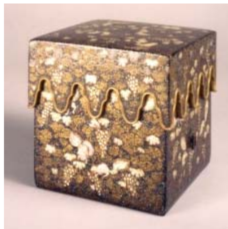
くろうるしぶどうり すらでんはくえきやらばこ 黒漆葡萄栗鼠螺鈿箔絵伽羅箱