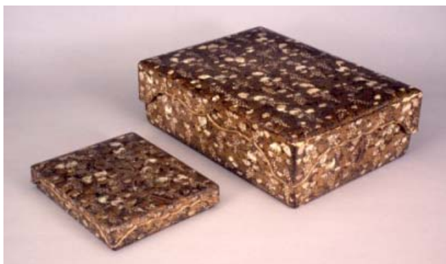
くろうるしぶどうりすらでんはくえりょうしばこすずりばこ 黒漆葡萄栗鼠螺鈿箔絵料紙箱・硯箱

◆お問い合わせ：首里城公園管理センター◆ TEL098-886-2020◇FAX098-886-2919