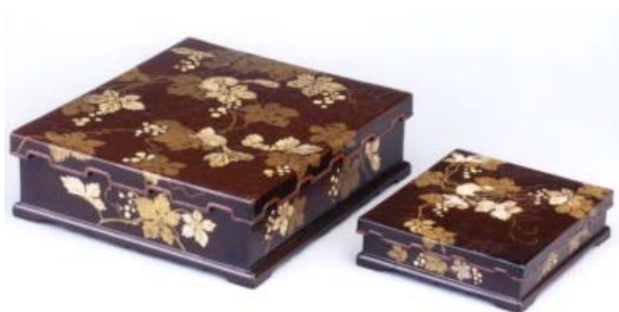
うるみぬりしぶどうり すらでんはくえりょうしばこ すずりばこ 潤塗葡萄栗鼠螺鈿箔絵料紙箱・硯箱